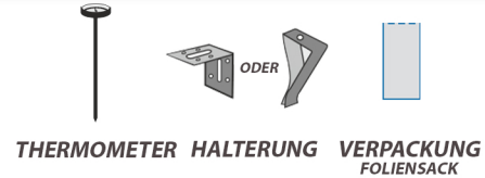
THERMOMETER HALTERUNG VERPACKUNG FOLIENSACK